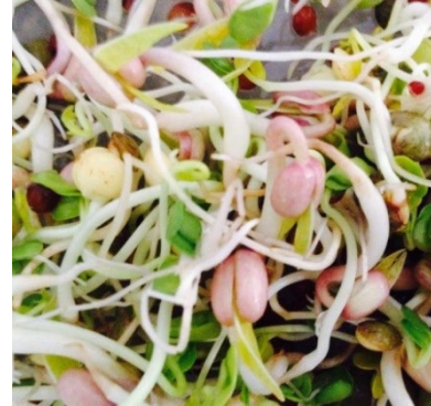
Germes / 5 jours