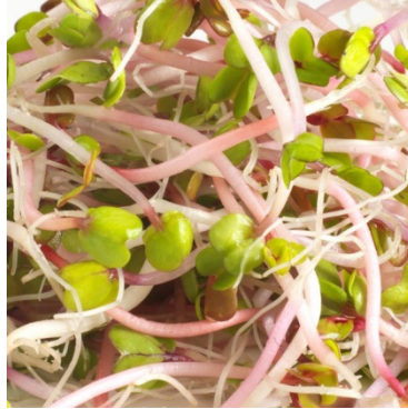
Germes / 4 jours