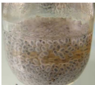
15 minutes trempage