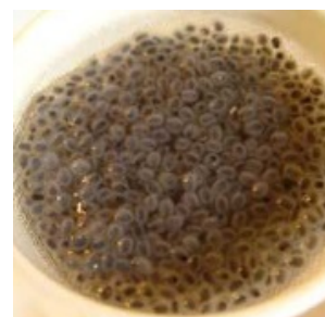
Prêt à planter