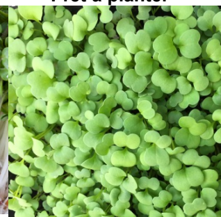
Pousse en pleine terre 14 jours

Goût Un goût rappelant le pistou et la feuille de basilic.