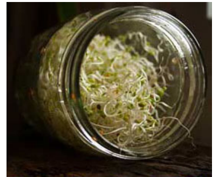
3 jours obscurité