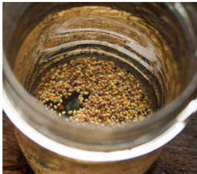
Trempage des graines

Note : lors du rinçage, retirez les écorces qui flottent ou qui restent au fond et nettoyez votre luzerne qui deviendra croustillante et qui se conservera mieux.